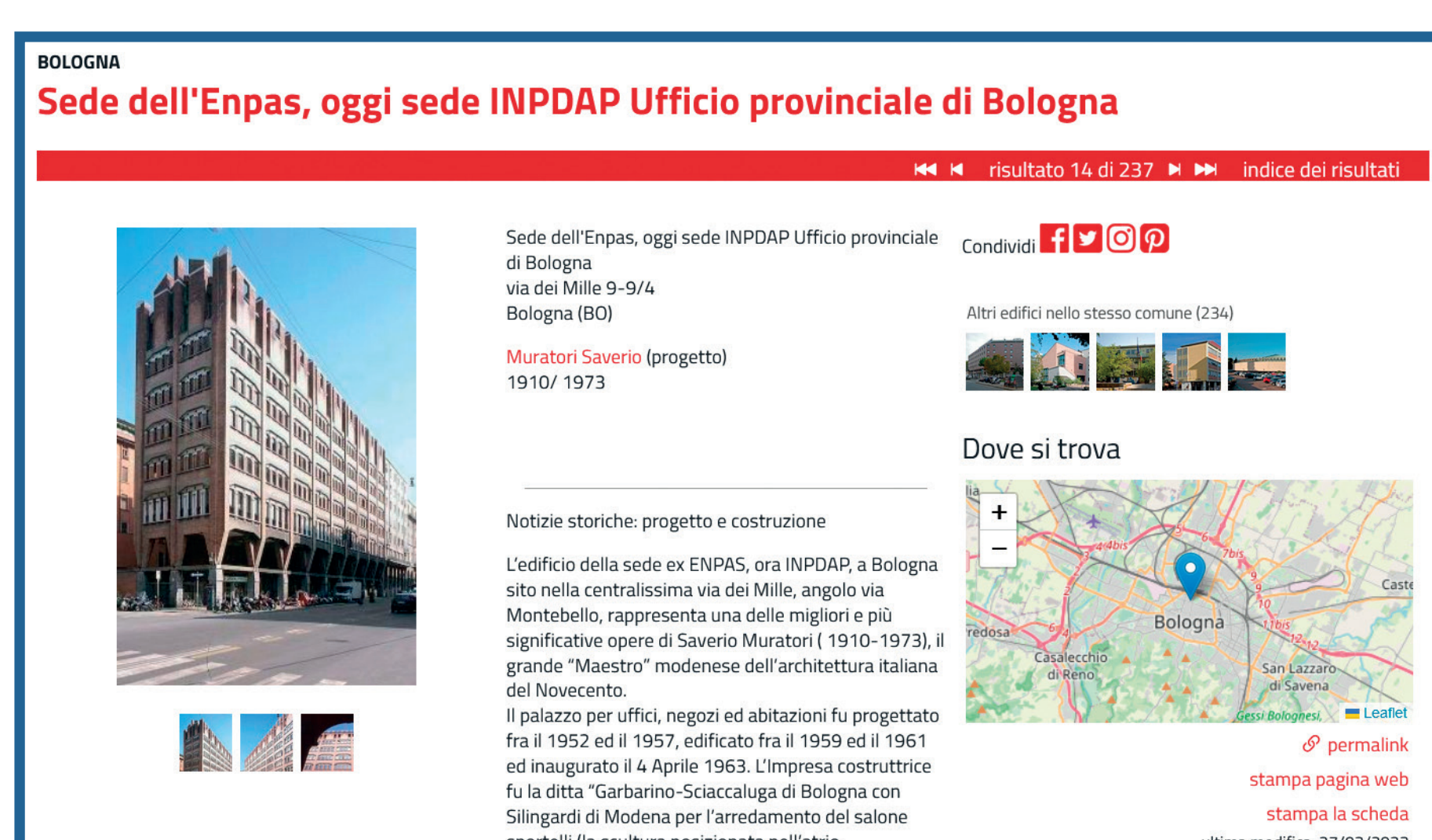
Scheda pubblicata in PatER-Catalogo regionale del Patrimonio culturale emiliano-romagnolo

Parallelamente sono state avviate attività di interlinking sempre più estese con dataset prodotti da altre istituzioni nazionali e internazionali. Un esempio dedicato al patrimonio architettonico: