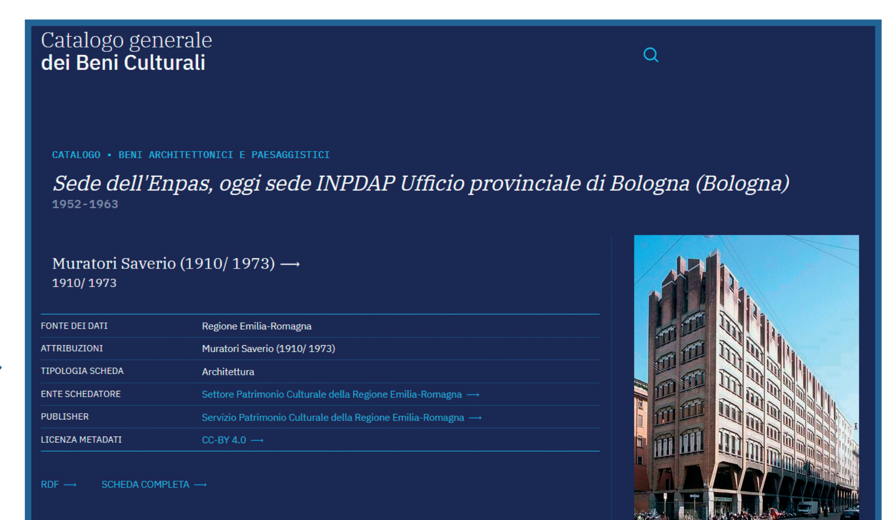
Scheda pubblicata nel Catalogo generale dei Beni Culturali (MiC-ICCD)

I dataset pubblicati dal Settore Patrimonio culturale sono accessibili tramite la piattaforma dati.emilia-romagna.it .