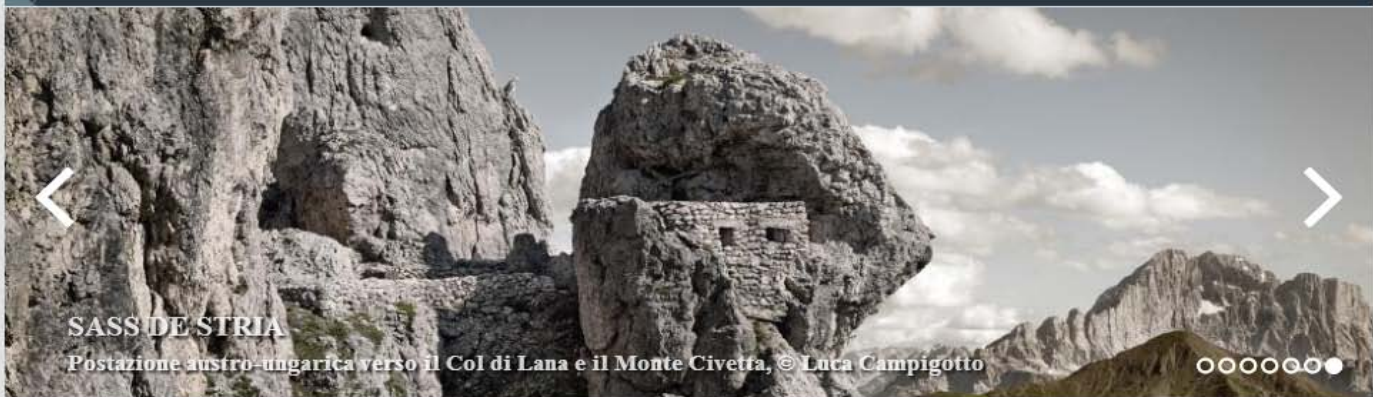
SASSI DI STRIA Postazione austro-ungarica verso il Col di Lana e il Monte Civetta