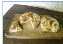
immagine del bene