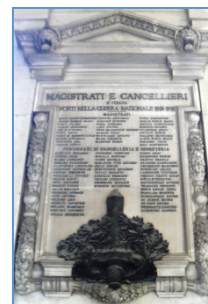
immagine del bene