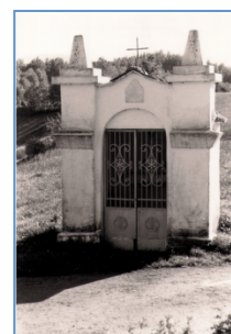
immagine del bene